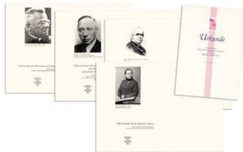
Mantelbögen für Ehrenurkunden